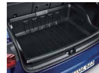
ラゲージライナー

ラゲージルーム全体をカバーする一体型タイプの大型トレーです。 ポリエチレン製で防水性を備え、汚れた物や濡れた物をラゲージ ルームを汚すことなくそのまま積み込むことができます。