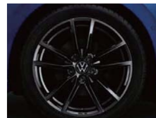
Pretoria/プレトリア グロスブラック