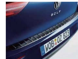
リヤバンパープレート(黒)

ラゲージルーム全体をカバーする一体型タイプの大型トレーです。 ポリエチレン製で防水性を備え、汚れた物や濡れた物をラゲージ ルームを汚すことなくそのまま積み込むことができます。