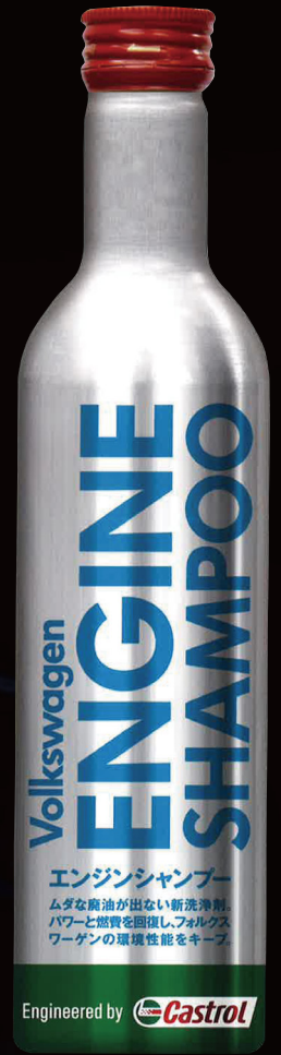
フォルクスワーゲン純正 エンジンシャンプー (300ml) J0VJD3501

ドライバーの皆さんにはあまり知られていませんが、短距離かつ短時間での走行、渋滞によるストップ＆ゴーの繰り返し、山道での連続走行など、エンジンに大きな負荷がかかると、エンジン内にはスラッジ(油泥)が堆積します。スラッジを放置するとエンジンパワーや燃費の低下につながります。そして、スラッジの堆積はエンジンオイル交換だけでは防ぐ事ができません。