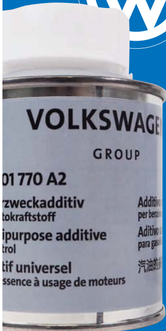
フォルクスワーゲン純正 ガソリン添加剤 (90ml) G001770A2