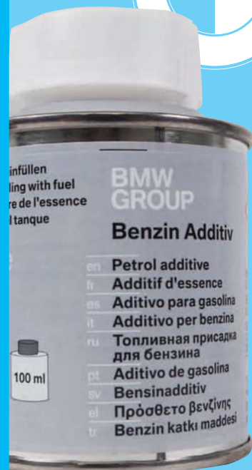
BMW純正 ガソリン添加剤 (100ml) ディーゼル添加剤 (100ml) 83192408560 83192296922