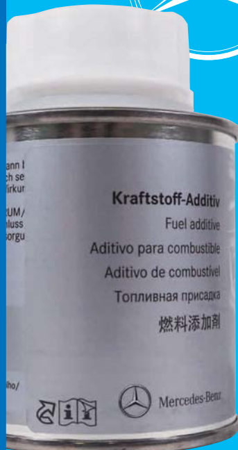
メルセデスベンツ純正 ガソリン添加剤 (100ml) ディーゼル添加剤 (90ml) 000989254516 000989304509