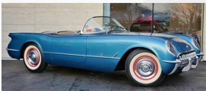
1955 シボレー コルベット