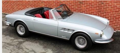
1968 フェラーリ 330