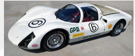
1966 ポルシェ カレラ6