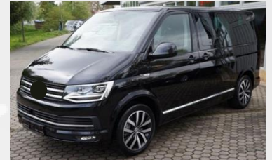
2017 VW T6 Multivan