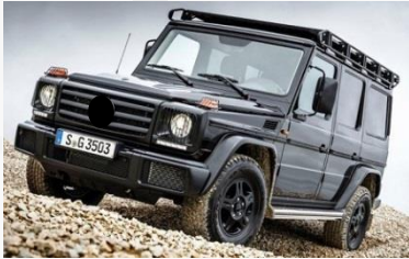
2017 G350 G professional

最新モデル、日本での数量限定モデル、日本未導入モデル、激レアクラシックなど気になる車両があれば、即納車・フルオーダー車問わずに今の円高を利用して欲しいものを世界から取り寄せましょう。