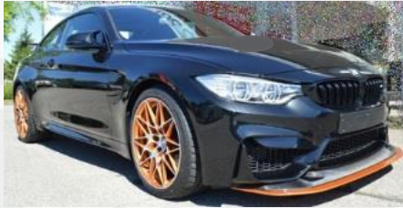
2016 BMW M4 GTS